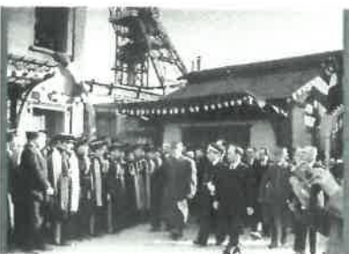
Légende : Visite de Philippe Pétain à Couriot