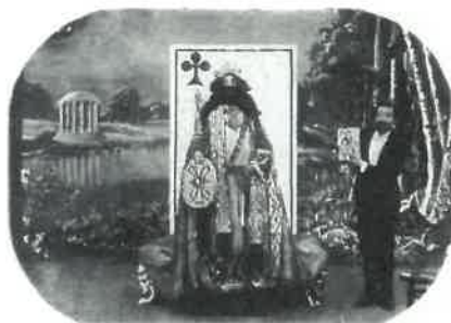
Légende Méliès et Les cartes diaboliques

Projection d'une série de courts-métrages réalisés par des illusionnistes du cinéma.