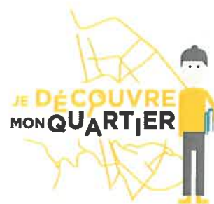
Légende : Je découvre mon quartier avec la petite archiviste ! (Création graphique Kaksi design)

Et si on enquêtait sur notre quartier ? Accompagnés par la petite archiviste qui les guide dans leur découverte, les élèves remontent le fil du temps et retracent l'histoire... Répartis en 4 équipes, ils plongent dans les documents d'archives pour y trouver des indices sur les habitants d'autrefois, un événement, un bâtiment et un personnage marquants du quartier.