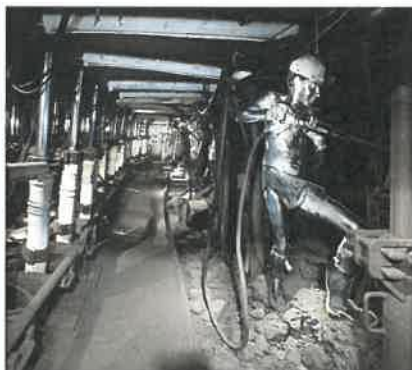
Légende : Galerie du musée de la mine

Puits Couriot / Parc-Musée de la Mine La mine, tout un cinéma !