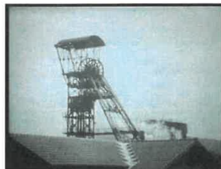
Légende : Etage 776