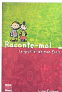
Légende : Couverture brochure pédagogique