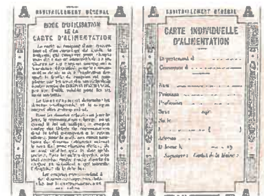
Légende : Carte de rationnement

Rendez-vous : Place de l'Hôtel de Ville - Arrivée : Place Fourneyron 2 accompagnateurs indispensables.