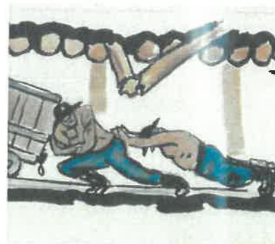
Légende : Arch. mun. de Saint-Étienne, 2 Fi ICONO 3640

L'atelier se déroule aux Archives municipales de Saint-Étienne ou salle Descours (précisé lors de la confirmation d'inscription).