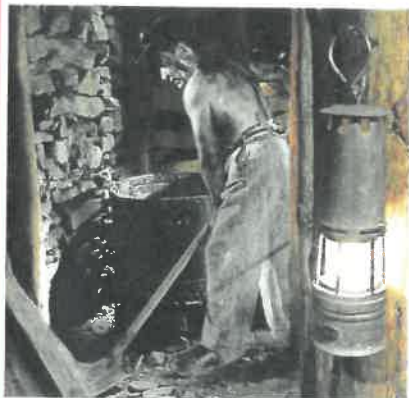
Légende : Pelleteur dans la galerie reconstituée XIXe s. du musée

Visiter le Musée de la Mine pour comprendre le fonctionnement d'un site minier au jour et au fond. Découvrir le circuit du charbon depuis la galerie jusqu'en surface et appréhender le travail des mineurs.