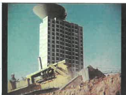
Légende : Construction de la tour Plein Ciel à Montreynaud.

Projection de films d'archives sur le quartier choisi ou sur le centre ville qui a été beaucoup filmé dès 1930. La Cinémathèque ne dispose pas toujours de 40 min de films sur tous les quartiers de la ville et votre venue est aussi pour découvrir des images d'archives sur Saint-Etienne. Nous regroupons deux classes si les quartiers sont proches. Quelques exemples de quartiers représentés en images filmées : Métare/Beaulieu, Beaubrun / Tarentaize, Montreynaud, Fauriel / Rond-Point, Centre 2 / Tréfilerie, Saint-François/Fourneyron/Châteaucreux/ Montat, Saint-Roch/Chavanelle.