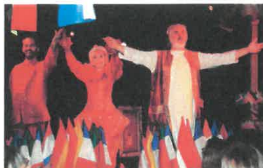
Légende Le Trophée des drapeaux