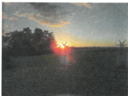
Légende : Coucher du soleil au crêt des 6 soleils

L'animation se déroule à l'extérieur en trois temps au crêt des six soleils, avec utilisation d'outils pédagogiques.